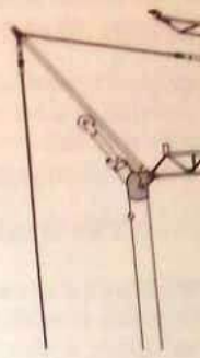
Schema della gru OMV 290 La configurazione b

Nella tabella e nello schema seguenti sono illustrate le configurazioni con le indicazioni degli sbracci, delle altezze delle portate, dei contrappesi, delle reazioni al suolo e delle principali misure di ingombro.